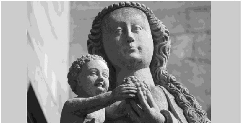
Dom St. Marien, Erfurt

S eit über 300 Jahren feiert die Kirche im Mai die Gottesmutter, da „der schönste Monat des Jahres der schönsten aller Frauen geweiht sein soll“. Die Freude über die neu blühende Natur erinnert an Maria, die Christus, das Heil der Welt, geboren hat.